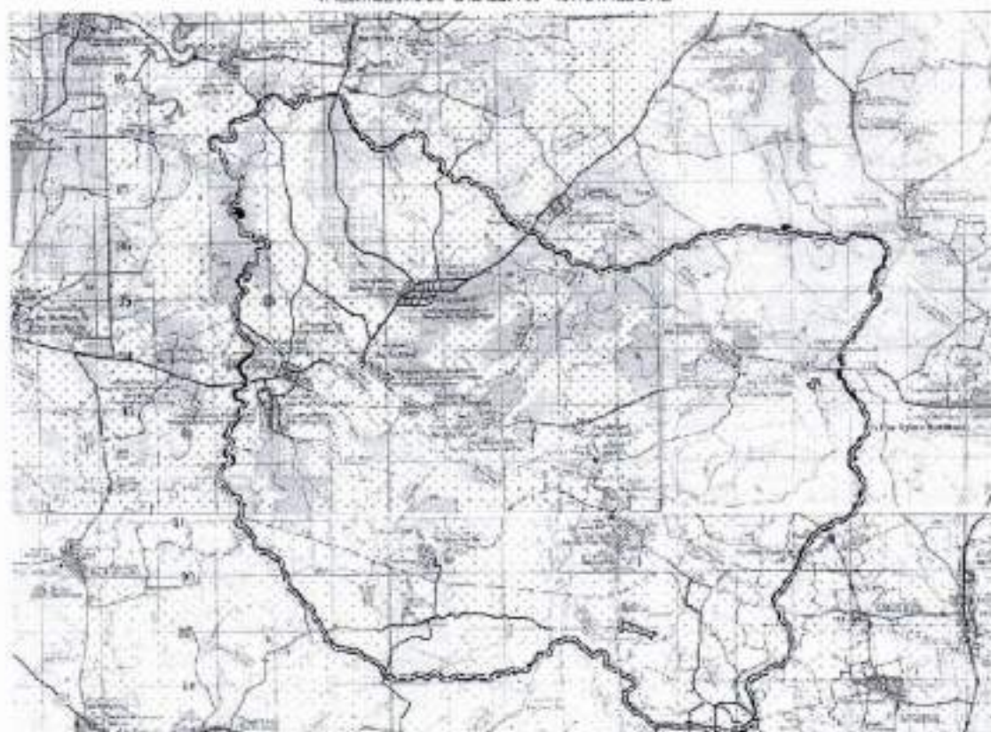
แผนที่แสดงตำบลหนองหลวง ตำบลหนองหลวง อำเภอเฝ้าไร่ จังหวัดหนองคาย

โดยตำบลหนองหลวง ตั้งอยู่ทางทิศตะวันตกของอำเภอเฝ้าไร่ อยู่ในเขตการปกครองของอำเภอเฝ้าไร่ ห่างจากตัวอำเภอระยะทาง ๕ กิโลเมตร ตำบลหนองหลวง มีทั้งหมด ๒๐ หมู่บ้าน